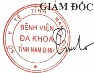
Trần Hùng Cường